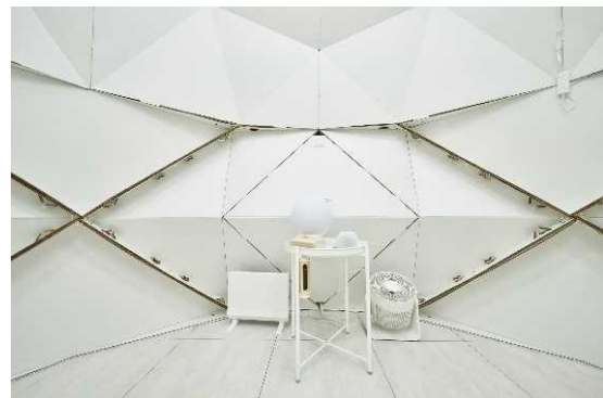
《プロダクトイメージ》