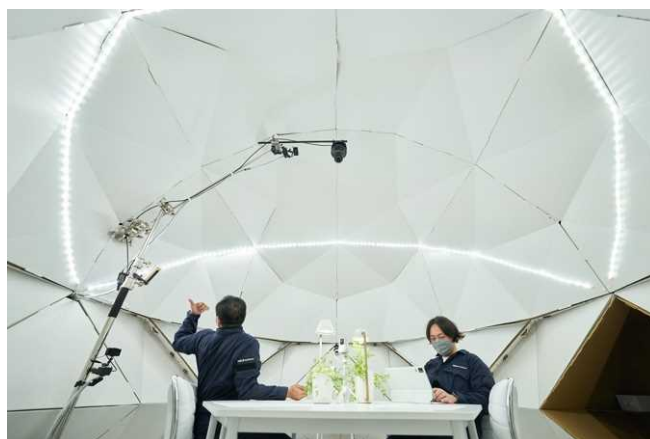
《プロダクト内装イメージ》