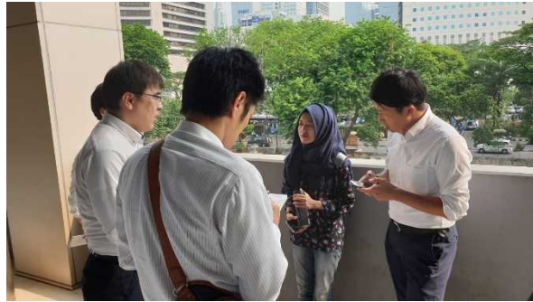
2019年インドネシア訪問の様子